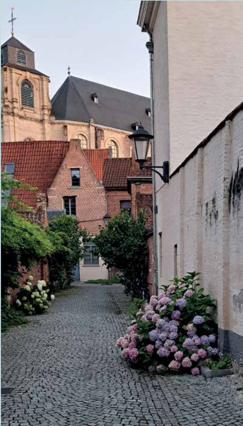
Acht Zalighedenstraat 2024