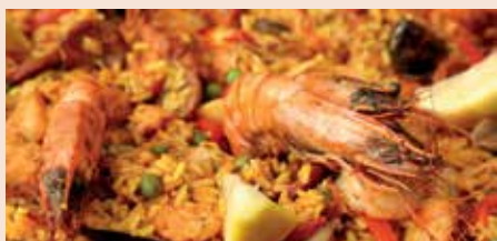
Het ziet er goed uit – een pluim voor de food-fotografie van Chris!