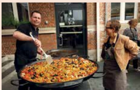
Inspectie van de pan