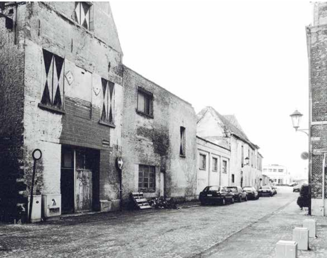
Zijmuur brouwerij Het Anker 1997

Eind 1904 veranderde de naam in brouwerij Het Anker.