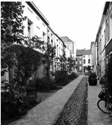
Korte Veluwestraat

Zoals in de vorige nieuwsbrieven al aangehaald werd, nemen we als Buurtwerking bewust geen stelling voor of tegen