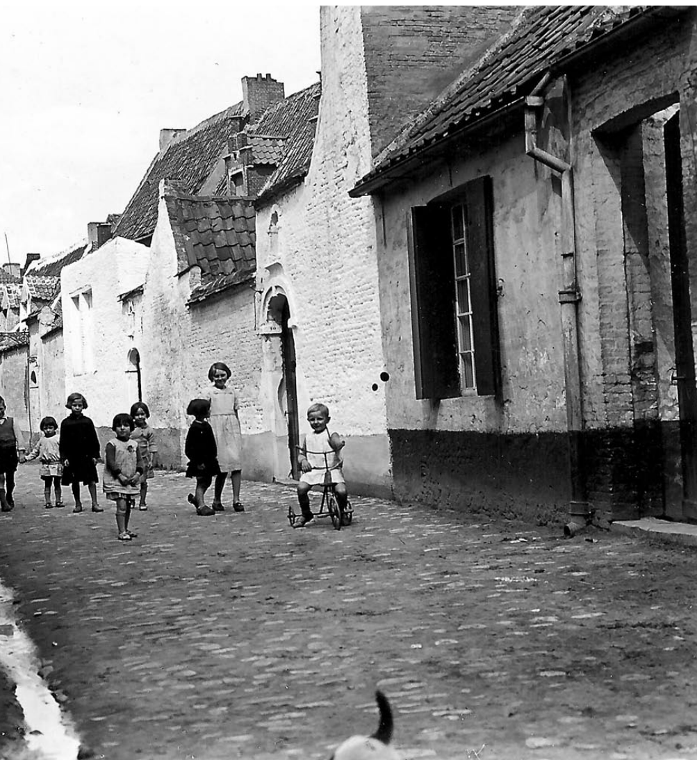
Eind jaren '20 van de 20ste eeuw