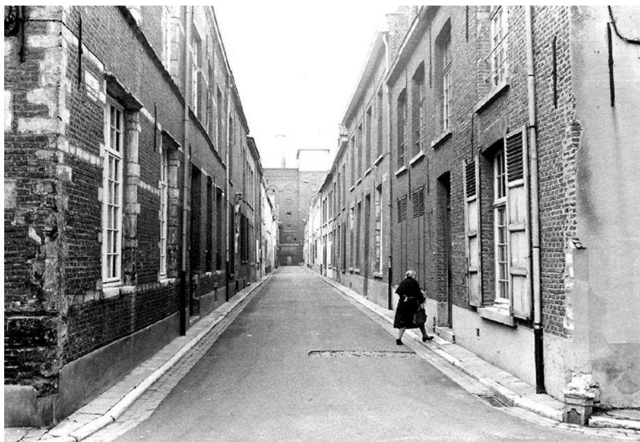
Hoviusstraat 2 in 1972