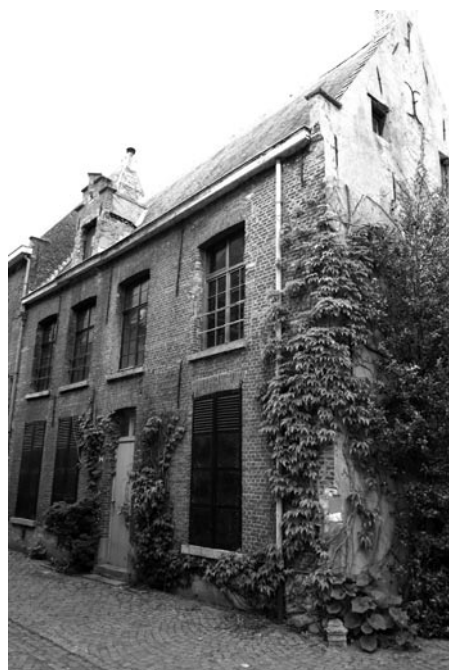
Hoviusstraat 2 in 2014