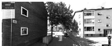
De Hoviusstraat in Hilversum