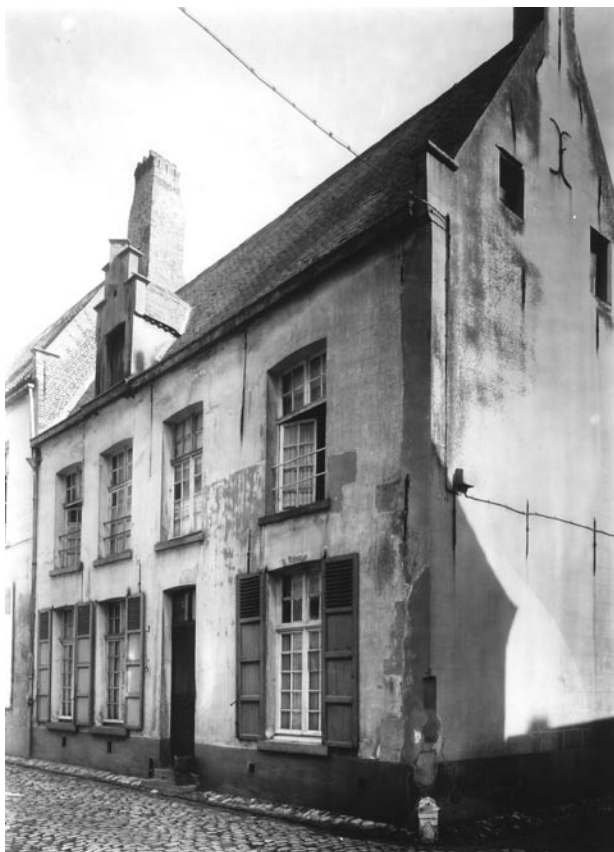
Hoviusstraat 2 in (vermoedelijk) 1948

Deze keer tonen we beelden van de Hoviusstraat nr. 2 (het Convent Sint-Barbara). Aan de drempelstenen en de hoeksteen merk je hoeveel de straat in de loop van de tijd opgehoogd werd.